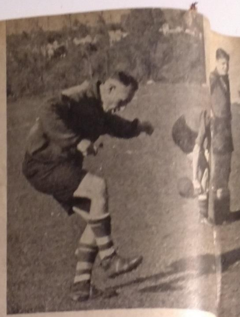
De oefenmeester demonstreert hoe een bal onder de voet gestopt moet worden.

Het ging Achilles goed in Kaufmann's tijd. Er werd goed en serieus getraind en het is zeker niet zonder trots, dat Kaufmann ons ter illustratie zegt: „Zelfs in de laatste kampioensploeg van Achilles